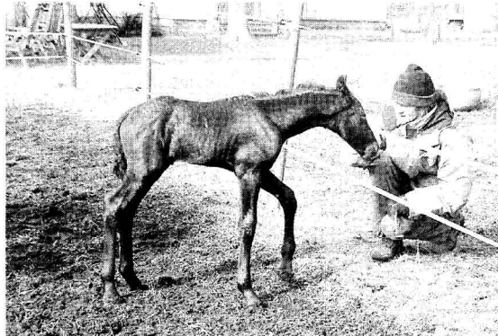
• In Zweden werd Figaro fan Hjelmestad geboren, een van de eerste veulens van Tjalf (v. Heinse).